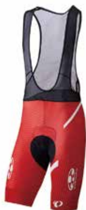
エアスピード ビブパンツ