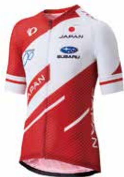
エアスピード ジャージ