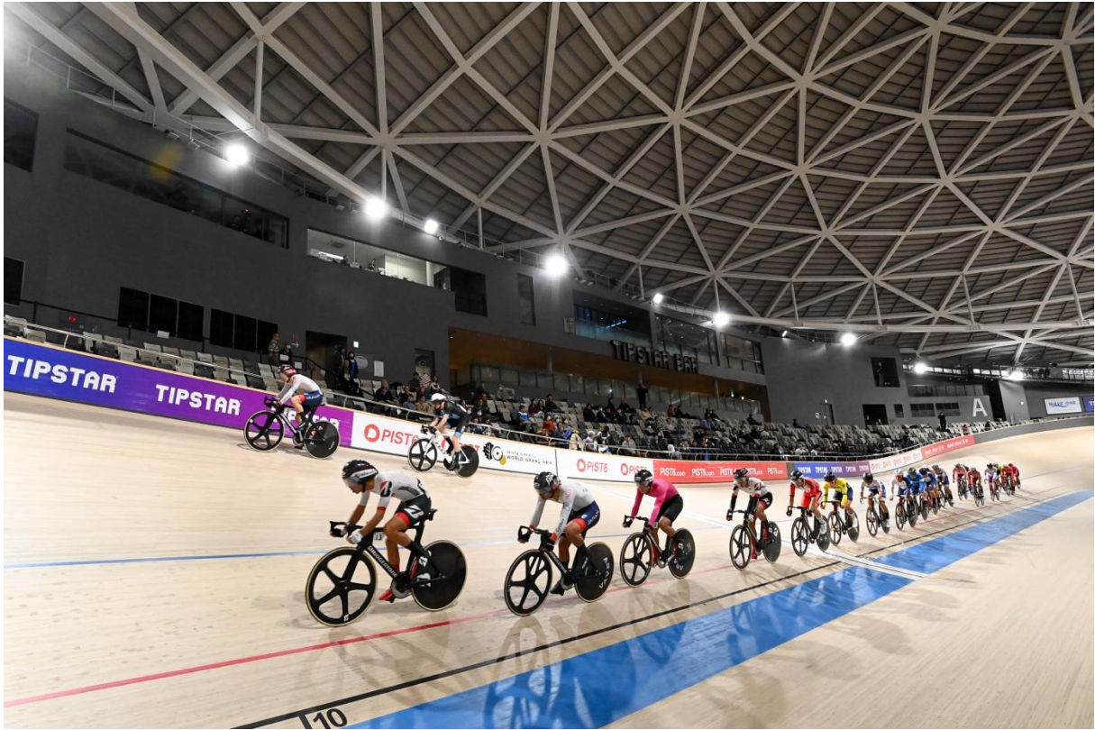
2023 年大会 女子オムニアム スクラッチレース