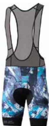
エアスピード半袖ジャージ エアスピードビブパンツ