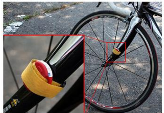
計測器の取り付け例